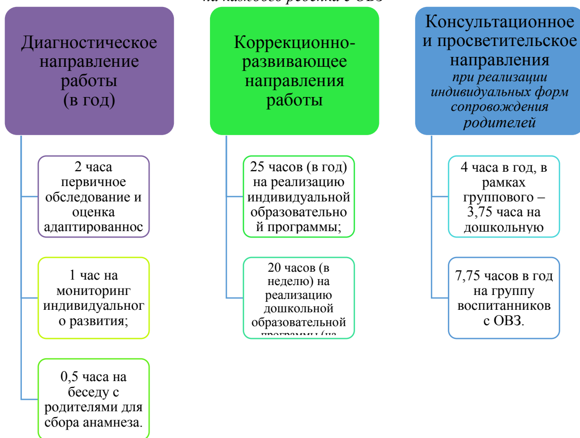
График организации образовательного процесса

В соответствии с письмом Минобрнауки РФ от 24.09.2009 N 06-1216 «О совершенствовании комплексной многопрофильной психолого-педагогической и медико-социально-правовой помощи обучающимся, воспитанникам», на каждого ребенка с ОВЗ